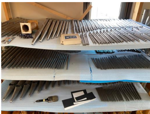
たくさんのパイプ(一部)

それと同時に、このオルガンも桜町教会のだいじな仲間なのだという思いが強く湧き上がり、より一層、奏楽の再開が楽しみになりました。ミサが再開されたら皆さんもぜひ、元気になって若返った桜町教会パイプオルガンの音色を味わってみてください。