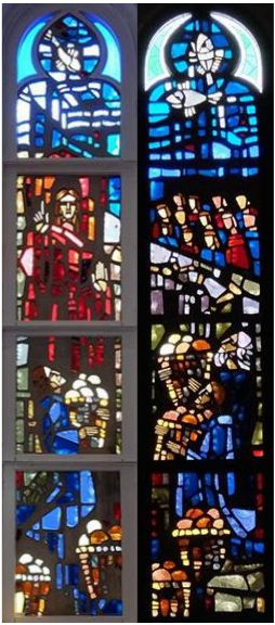
【イエスはパンと魚をふやす】 マルコ8:1