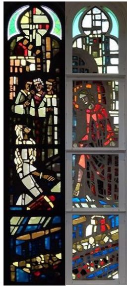
【イエスは盲人を癒やす】 ヨハネ9:1