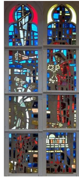
【ペトロの信仰告白】 マタイ16:13