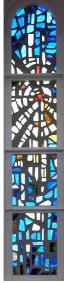
ガラス・デザイン (採光) 渡邊真さん制作