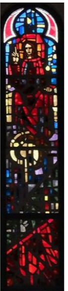
【最後の審判とイエスの勝利】 右側