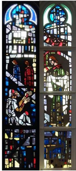
【良きサマリア人のたとえ話】 ルカ10:25