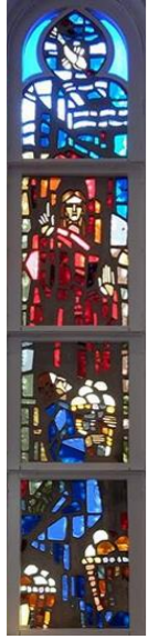
【イエスはパンと魚をふやす】 左側 (右側は桜町教会)