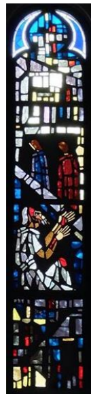
【良きサマリア人のたとえ話】 左側 (右側は宮崎教会)