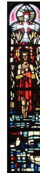
【イエスはヨルダン川で洗礼を受ける】 右側 (左側は宮崎教会)