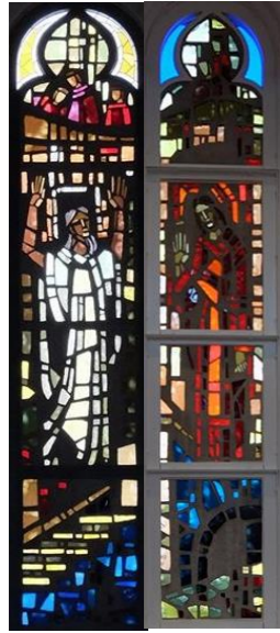
【イエスはラザロをよみがえらせる】 ヨハネ11:1