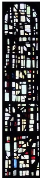
ガラス・デザイン (採光)