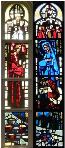
【イエスはカナで水をブドウ酒に変える】 ヨハネ2:1