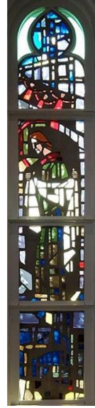
【良きサマリア人のたとえ話】 右側 (左側は桜町教会)