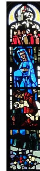
【イエスはカナで水をブドウ酒に変える】 右側 (左側は宮崎教会)