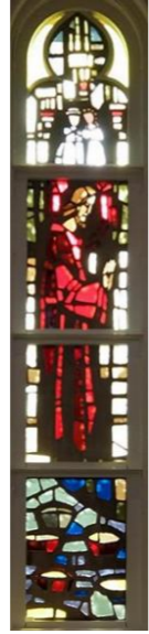
【イエスはカナで水をブドウ酒に変える】 左側 (右側は桜町教会)