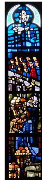
【イエスはパンと魚をふやす】 右側 (左側は宮崎教会)