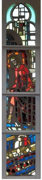
【イエスは盲人を癒やす】 右側 (左側は桜町教会)