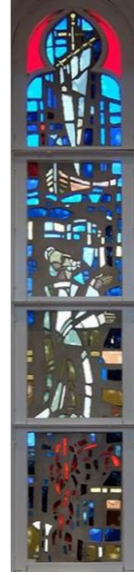
【ペトロの信仰告白】 左側