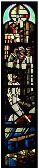
【イエスは盲人を癒やす】 左側 (右側は宮崎教会)