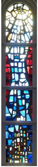
ガラス・デザイン (採光) 渡邊真さん制作