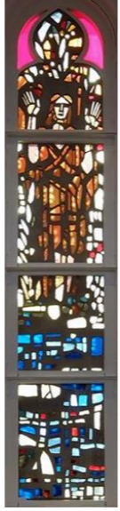
【イエスはヨルダン川で洗礼を受ける】 左側 (右側は桜町教会)